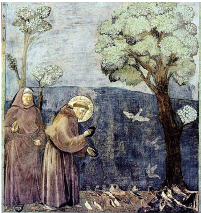
Giotto di Bondone, «La predica agli uccelli», 1290-1295 circa